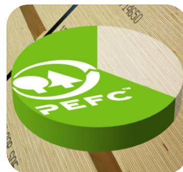
⅓ van het gecertificeerde hout op de Nederlandse markt is afkomstig uit PEFC gecertificeerd bos